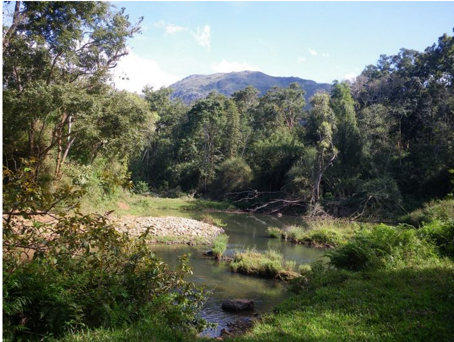
Nilgiris, река Мойар в заповеднике Mudumalai.

лимнофильные группы – выносливые к заморам, застоям и перегревам. Это жуки (плавунцы, нотериды), клопы (гладыши, гребляки Micronecta , водомерки), стрекозы ( Libellulidae , Coenagrionidae ), креветки ( Macrobrachium , Caridina ), крабы и улитки (в основном Melanoides и Thiara ). Население прудов и речек выглядит довольно сходно – очень похоже, что речкам вскоре распасться на серии луж совсем без течения. Сообщества перекаатов бедны видами; их комплекуют Hydropsychidae , Baetis , Ecdyonurus , Caenis , Leptophlebiidae , Psephenidae , опять же крабы и креветки Caridina .