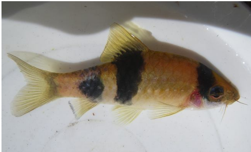
Барбус из речки Modi-hole, близ Agumbe.

5. Заросли макрофитов. Обычно развиты слабо и представлены отдельными куртинами на умеренном течении, не гасящими напор воды. Обычно преобладают поденки Baetis.