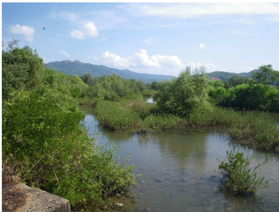
Гоа, эстуарный залив под Палолемом.

Устья впадающих в море ручьев и рек обычно образуют обширные мелководные заливы, глубоко вдающиеся в сушу и отчасти обсыхающие в отлив. Опреснение в них невелико в силу малой полноводности притоков, по берегам иногда вырастают мангровые заросли. Ближе к южной оконечности Индостана (под Кочином и Алеппи) эти внутренние околморские акватории образуют огромную систему озер, проливов и островов; мы туда попасть не успели.