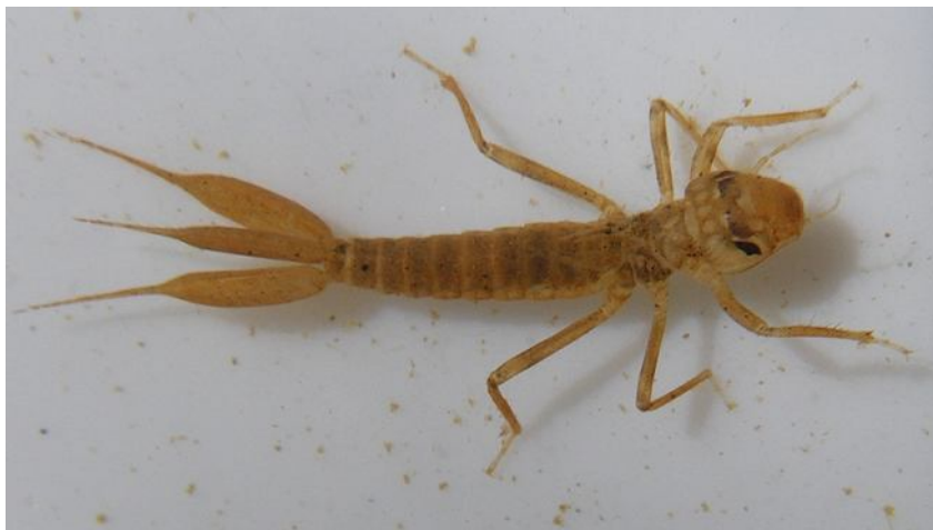
Реофильная стрекоза сем. Euphaeidae, р. Agumbe-hole.

Лимнофильные сообщества (в разного рода копанных и плотинных прудах, ямах и лужах) близки к таковым равнин. Их слагают многочисленные стрекозы (Libellulidae, Coenagrionidae, Coenagrionidae), поденки Cloeon, клопы (Anisops, Enithares, Micronecta, Pleidae, Gerridae, Veliidae), жуки (Laccophilus и другие плавунцы, Noteridae, Hydrophilidae), креветки Macrobrachium, улитки Lymnaea, Anisus, Melanoides.