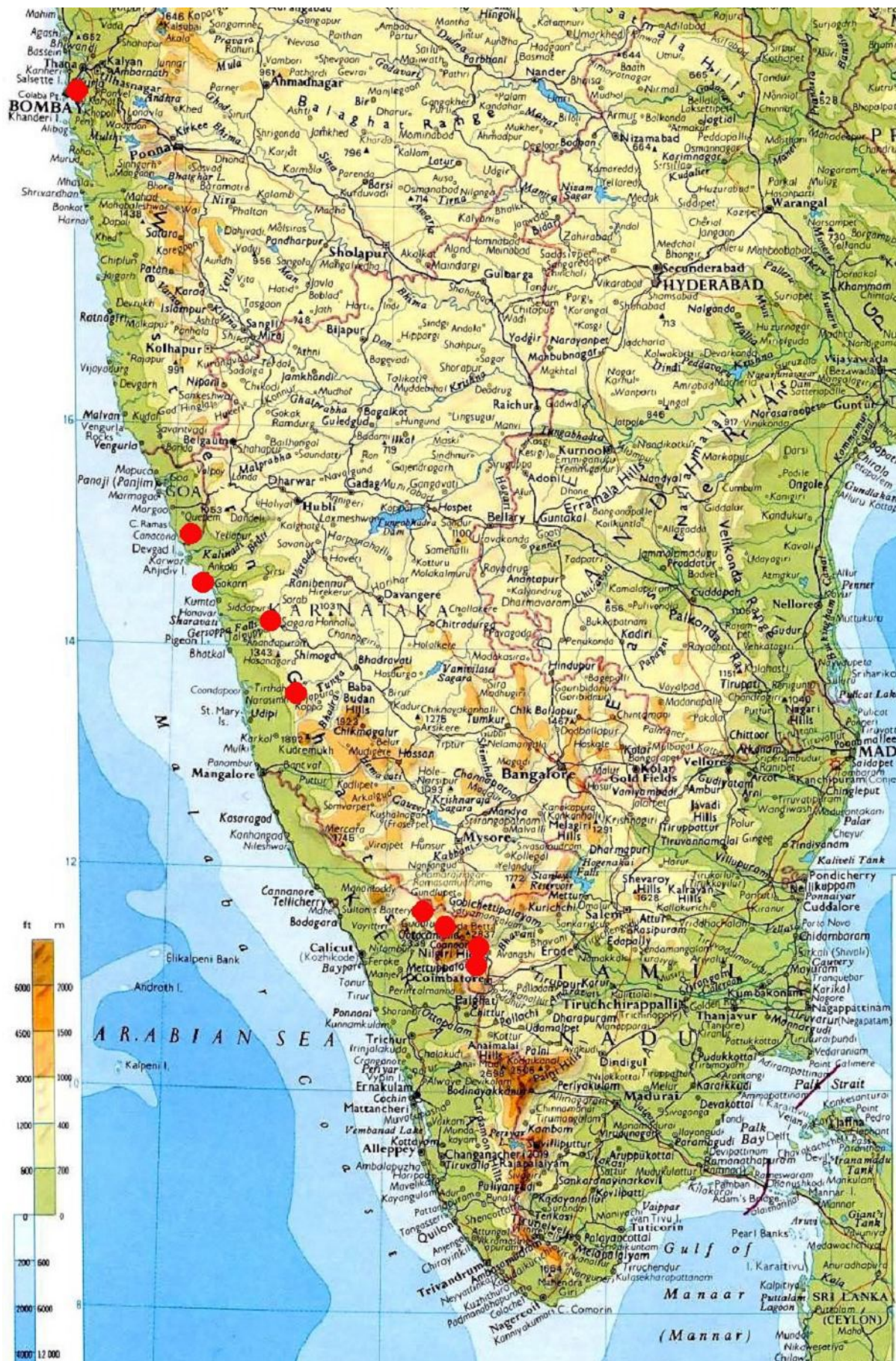
Карта Южной Индии и обследованные места.