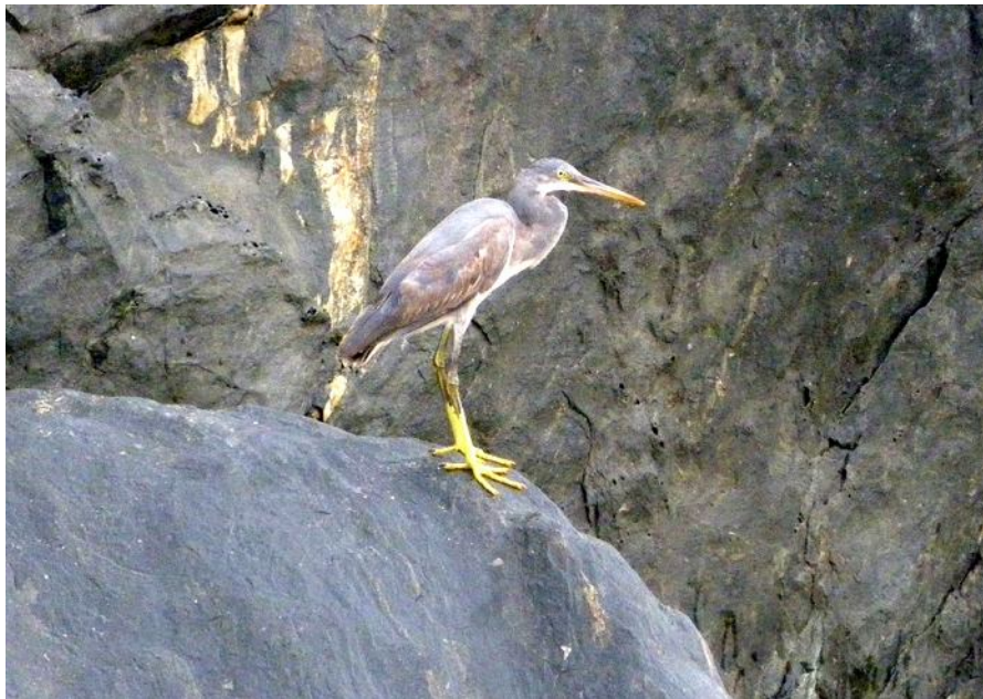
Гокарна, рифовая цапля на прибрежных скалах.

Вопреки своей перенаселенности людьми, Индия довольно богата крупными дикими животными. По крайней мере, несколько видов оленей и обезьян распространены практически во всех сохранившихся лесах – начиная от парка Santhya Ghandi в Бомбее, и кончая крупными заповедниками под Гудалуром. Более экзотические животные (дикие быки, слоны и тигры) сохранились мозаично, и вокруг их популяций везде организованы охраняемые зоны. Однако, все тут несложно. Например, оживленный городок Sultan Battery потребовал 2 километра, чтобы выйти из него по северной дороге, после чего сразу сменился заповедником Wayanad (лес отделен от шоссе глубоким рвом, но местные жители местами кладут через него доски), и уже в километре от города лес был весь истоптан следами слонов и гауров, а еще через километр мы встретили и тех, и других. Правда, в других местах таких эффектов быстро достичь не удалось – только олени.