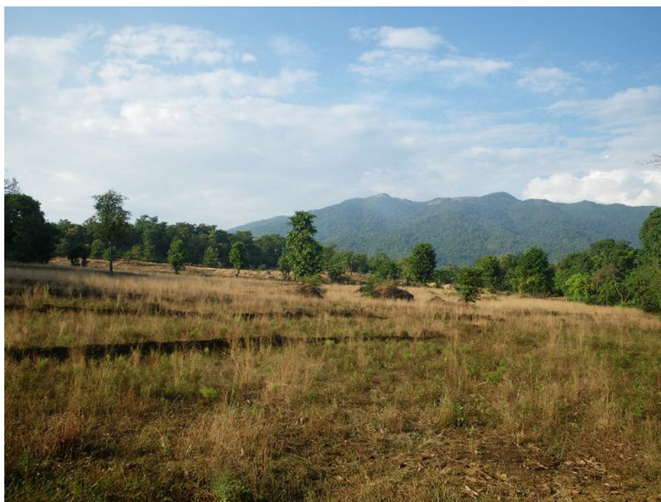
Гоа, саванноподобный ландшафт внутренних территорий.

Уже в километре от моря Гоа – вполне типичная индийская территория, безо всякой курортной мишуры. Каменистые холмы поросли где подсыхающей травой, где