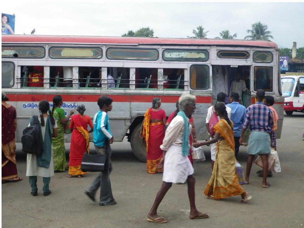
Люди и автобус. Обратите внимание, как они одеты!

голым детям заметно, что украшения первичнее одежды! Так что, например, женский вагон в эленктричке выглядит очень празднично.