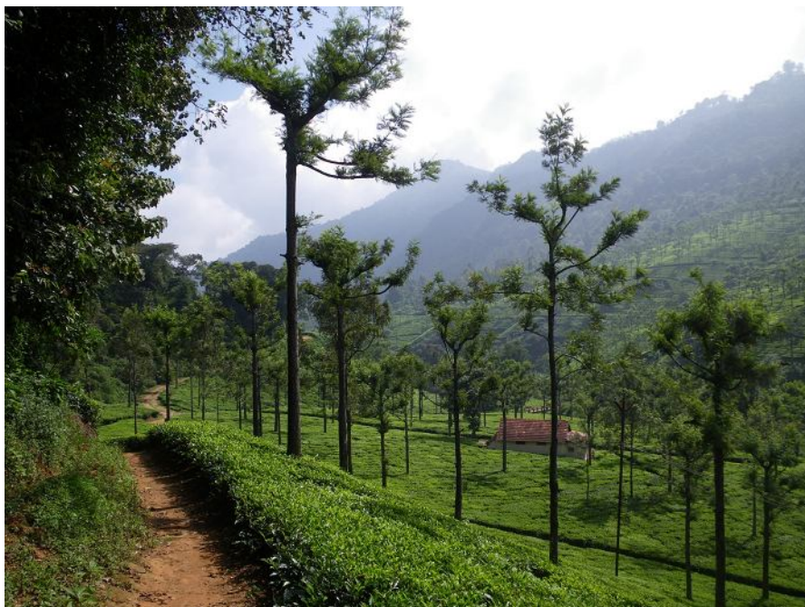
Чайные плантации под г.Кунур.

Под нагорьем, на высотах 800-1200 м, расположены уже тропические (то есть жаркие) лесные массивы с сохранившимися популяциями всяких крупных зверей (тигров, слонов, быков), заключенные в заповедники Mudumalai (под Гудалуром) и Wayanad (под Sultan Battery). Здесь правда странный лес, на грани саванны – все истоптано большими следами, подлеска почти нет, и на каждом шагу какой-нибудь помет. А в подстилке живут маленькие кусачие клещи; вечером после лесной экскурсии можно собрать их с себя несколько десятков. Они легко соскабливаются, но наследством от них стала зудящая сыпь, дающая себя знать потом еще несколько недель. Не зря в Mudumalai проводят только автобусные экскурсии-сафари!