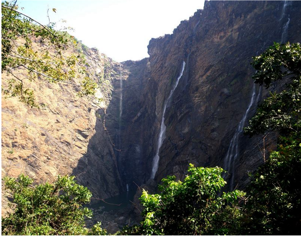
Водопады Jogg Falls.

крупной осыпью на дне. Вода спадает с огромных скал несколькими белыми струями. Весьма причудливое зрелище; местных привозят сюда на 1-2-дневные экскурсии целыми автобусами, особенно школьников. Вниз по каменисто-кустарниковому склону проделана тропа-лестенка (сейчас как раз шла ее реконструкция до полноценной бетонной лестницы). Народ в массе ходит на дно, фотографирует водопад снизу и плещется в озерке. Мы отошли по каньону еще на 500 метров вниз и купались в другом озерке. Дно каньона, правда, все в крупных камнях, так что далеко не уйдешь.