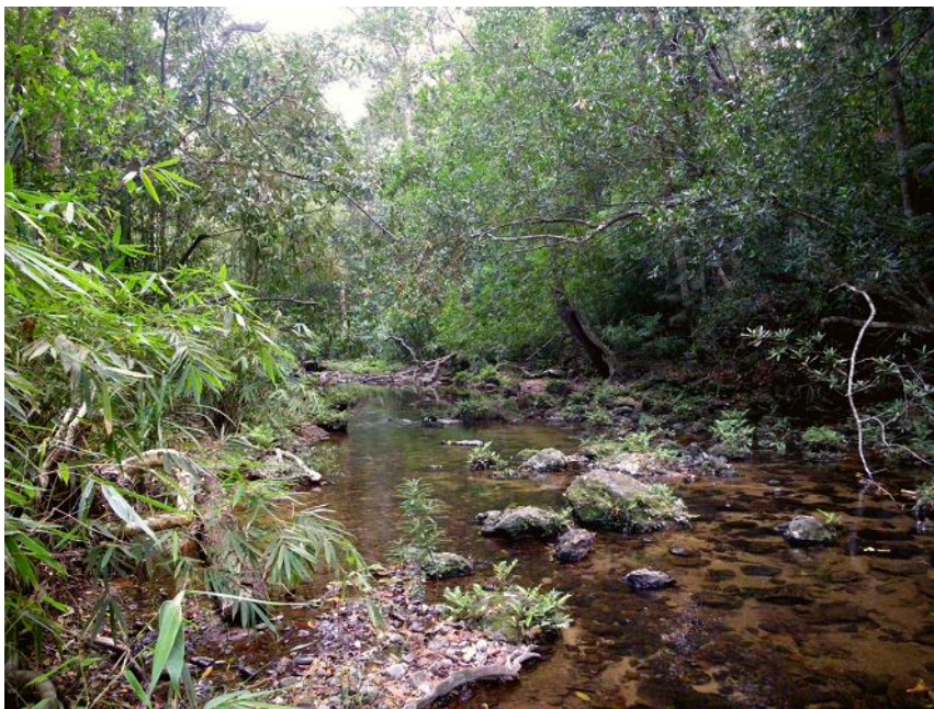
Речка Agumbe-hole в джунглях.

Под спуском с хребта находится долина реки Setinadi и стоит поселок Someshwar. Тут мы тоже отошли от шоссе пару километров по первой попавшейся тропе и стояли на речке Modi-hole. Тропы в лесу ведут к отдельным домикам-фермам; так что далеко через лес уйти трудно. Налегке можно потихоньку ходить через лес с тропы на тропу или вдоль русел подсыхающих ручьев.