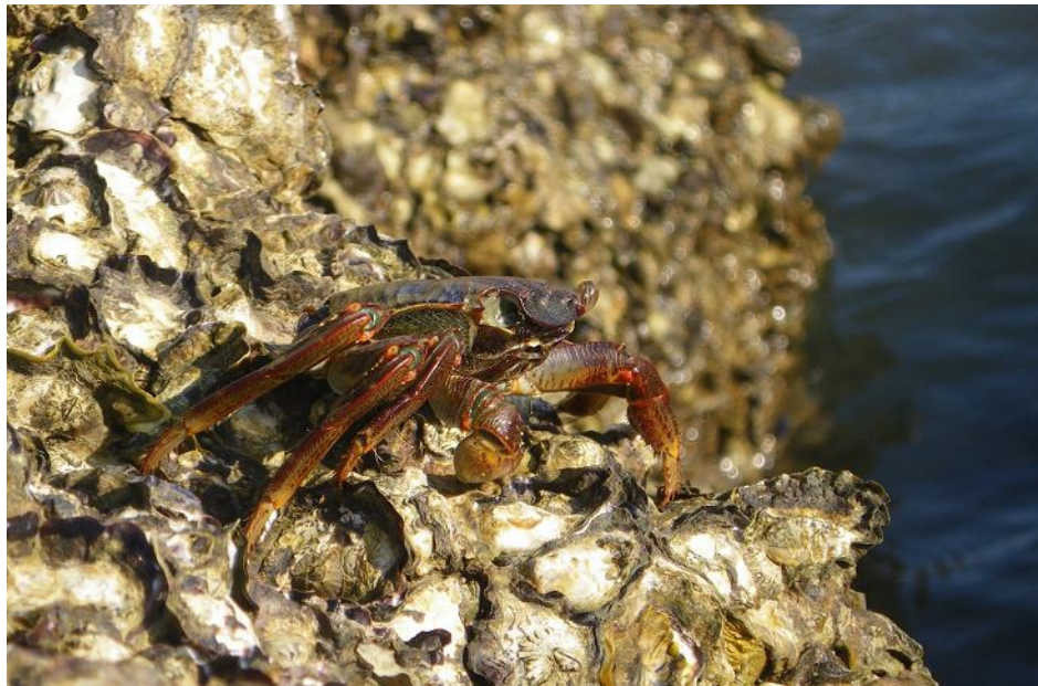
Скальный краб Grapsus на устричной поверхности.

Высота прилива здесь около метра, что дает на пологих пляжах примерно стометровую литораль. Обширные мелкопесчаные пляжи в Гоа и Гокарне – не только прекрасный курорт, но (поскольку отдыхающих умеренно много) довольно интересная литоральная экосистема. Основным видимым ее элементом являются крабы. Это быстро бегающие, замаскированные под песок крабы-привидения Acipoda , плавающе-роющие крупные плоские крабы Ashtoret lunaris , сидящие у своих норок и катающие шарики из песка .... Ночью ближе к поверхности песка вылезают и настоящие роющие существа – монетчатые крабы Philyra scabriscula и крабокроты Nippra . Каждая отливающая прибойная волна уносит песок и вымывает на поверхность десятки этих мелких созданий, а они быстро-быстро закапываются обратно. И не зря – даже ночью их промышляют кулики. Вместе с ними вымываются небольшие двустворки. Реже (в лагунах между камней, где ослаблен прибой и не купаются люди) встречаются большие черные голотурии.