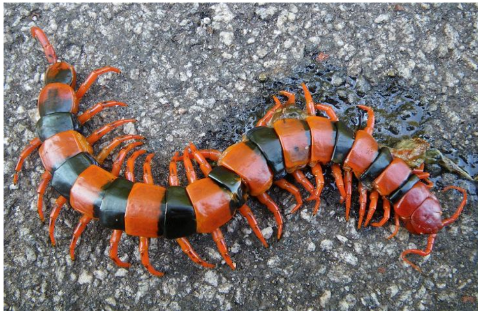
Сколопендра на дороге под с. Agumbe.

Как в большинства тропических регионов, лесная подстилка почти везде довольно сухая и выполнена жестколистными фрагментами. Подстилающие породы в основном кристаллические, минерализация воды и почвы стремится к нулю. Соответственно, в подстилке много муравьев, иногда также термитов, тараканов и многоножек, а наземных улиток практически нет. Усердное копание, впрочем, может подарить несколько старых пустых ракушек. За месяц работы было найдено около 50 экземпляров примерно 15 видов.