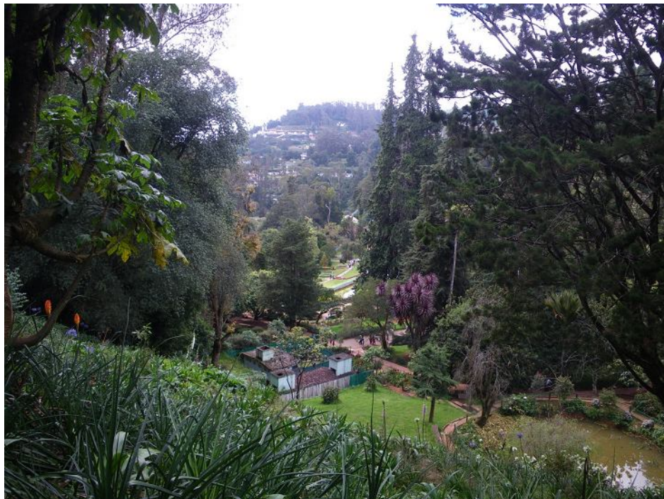
Ботанический сад в городе Ути.

Nilgiris. Нильгирис – один из наиболее высокогорных районов в Западных Гатах, с нагорьем на высотах 2000-2200 м и вершинами до 2600 м, расположенный между городами Коимбатур, Майсур и Каликут. Западные Гаты – вообще не совсем хребет, в наиболее высокой южной части они распадаются на почти столоподобные нагорья с равниной в промежутках. Здесь относительно прохладный (днем 15-25, ночью 10-15°) и влажный, как бы субтропический климат, леса сложены тиком и мимозой, но еще хорошо растет чай. Это еще англичане придумали – здесь чай выращивать; теперь почти весь лес на склонах (кроме самых крутых) сведен и замещен плантациями чая; и народу довольно много.