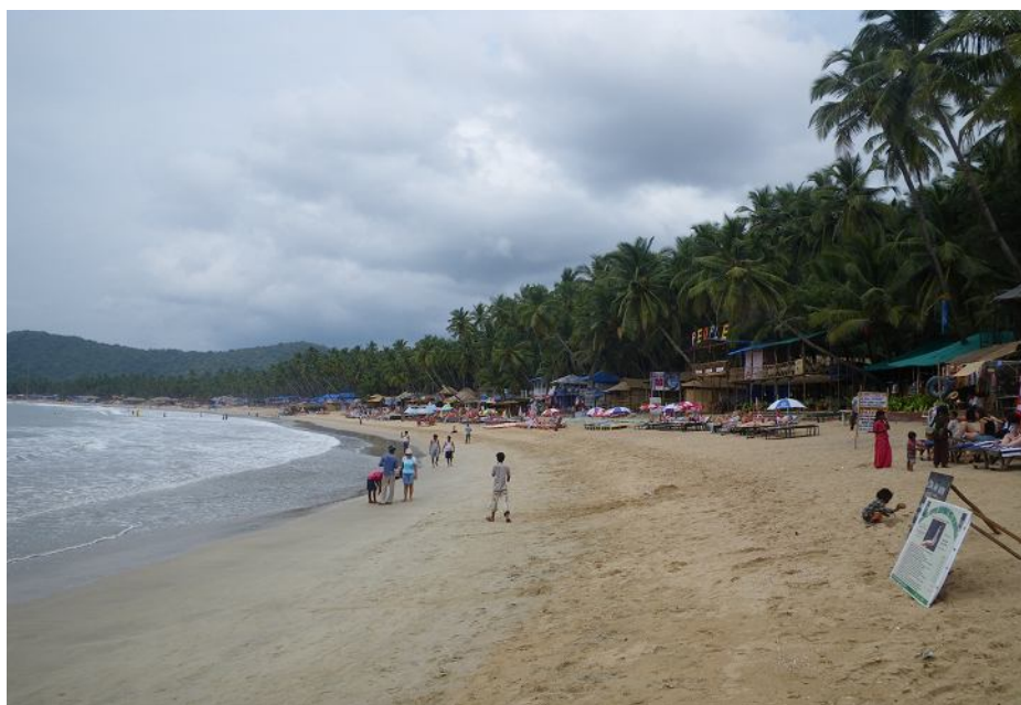
Гоа, пляж Palolem Beach

Дома местных жителей обычно расположены еще несколько глубже в сушу, вдоль прибрежной дороги; туда же выходит большинство лавочек. Отдыхающие – преимущественно европейская молодежь богемного вида (волосатые, бородатые и ходят в черти чем). Так исторически сложилось – в Гоа любили жить хиппи, и пляжная инфраструктура сложилась соответствующая – низкого уровня, но дешевая. На некоторых пляжах построены отели более высокого класса; но в них почти никто не живет. Еще на те же пляжи приезжает (главным образом на выходные) местный средний класс – важные упитанные индусы, которые даже пытаются купаться в море (в шортах и платках). Плавать они не умеют, купальников не носят и вообще предпочитают играть на пляже в мячик.