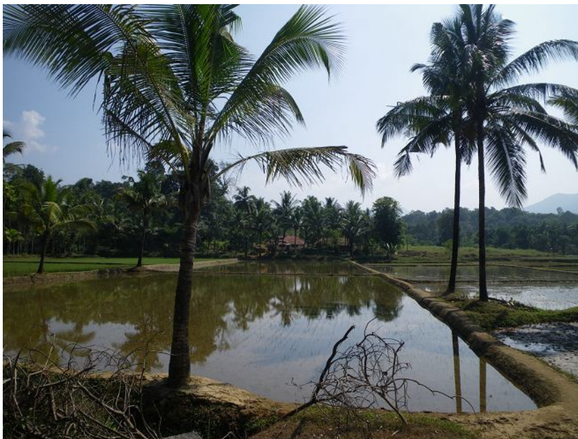
Ферма под пос.Someshwar. Рисовые чеки.

И в Агумбе, и в Сомешваре, и местами в Джогфаллс вдоль ручьев и речек (где подстилка посырее) масса наземных пиявок. Они прекрасно ориентируются на дичь: стоит остановиться и присмотреться – видишь, как червяки широкими шагами идут к тебе со всех сторон, и самые шустрые уже поднимаются по ботинкам. Лучше поэтому останавливаться либо на сухих местах, либо у речек на больших камнях, и почаще осматривать ноги. Когда берешь пробы в ручье, за этим уследить трудно, так что ноги нам подырявили изрядно. Хотя северный гнус все равно хуже.