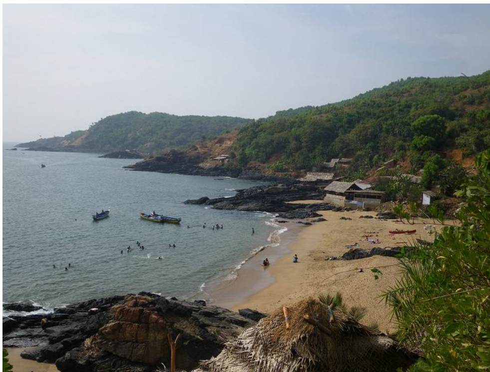
Гокарна, пляж Paradise Beach. Выходные – на лодках наехало много местных.

Gokarna. Гокарна – небольшой городок на севере штата Карнатака, в полусотне километров от границы с Гоа, расположенный на небольшом вулканическом полуострове. Сам городок известен одной индуистской святыней, а пляжи возле него с недавних пор стали развиваться как курорты для белых. Здесь всего два больших пляжа (Kudle Beach и Om Beach), по километру длиной, и два маленьких, без дорог и электричества – Halfmoon Beach и Paradise Beach. Хижин и ресторанов меньше, чем в Гоа, а белого народу – даже больше. Понимаете, во всех современных описаниях значится, что Гокарна – очень тихое, безлюдное и дешевое место! Вот народ и едет. А купание такое же точно – мутноватая вода +28, мелкий песок и мощный накат. На холмах над пляжами – действительно лавоподобные породы, жестколистные колючие кустарники и странные небольшие деревца с полулунными листьями.